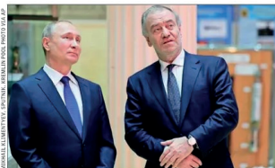
Valeri Guerguiev no denunció la ofensiva rusa en Ucrania, lo que le ha valido problemas en occidente, pero el apoyo de Putin (izquierda).

Putin sugirió en marzo de 2022 fusionar la dirección de los dos prestigiosos teatros, como era habitual antes de la revolu-